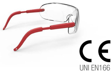
RC20DPI001 □ E 4,50 P OCCHIALE PROTETTIVO "DANDY" AD ASTE REGOLABILI