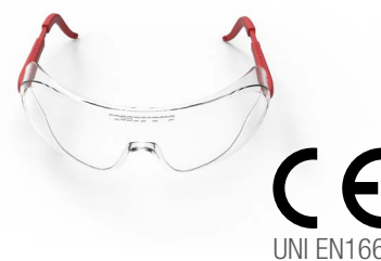
RC20DPI002 □ E 6,98 P OCCHIALE PROTETTIVO "DANDY" AD ASTE REGOLABILI CON LENTE ANTIGRAFFIO