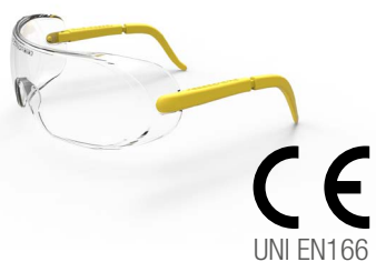
RC20DPI000 □ E 3,90 P OCCHIALE PROTETTIVO "DANDY" AD ASTE FISSE