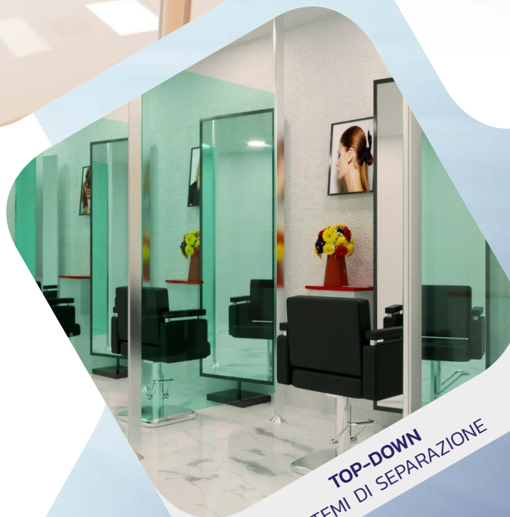
TOP-DOWN SISTEMI DI SEPARAZIONE