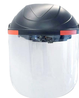
RC20DPI302 □ E 22,00 P VISIERA PROTETTIVA REGOLABILE "FRIENDLY", IN POLICARBONATO, ANTIGRAFFIO E ANTIAPANNAMENTO